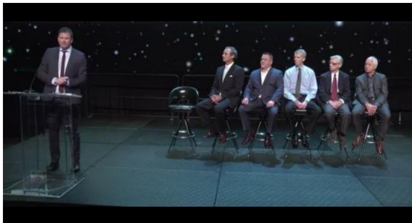
La presentazione di ottobre 2017