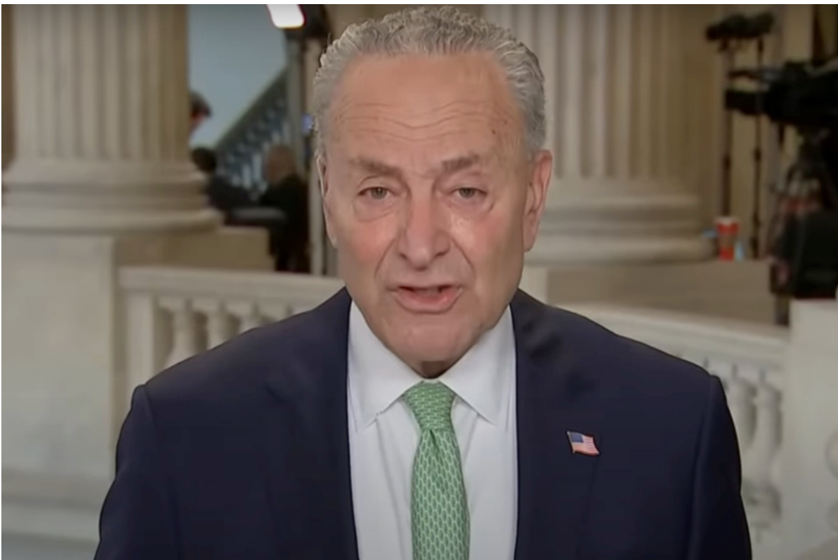
Il Leader del Senato Chuck Schumer

Il Congresso avvia un piano per rivelare le "tecnologie di origine sconosciuta e le prove biologiche di intelligenze non umane" recuperate.