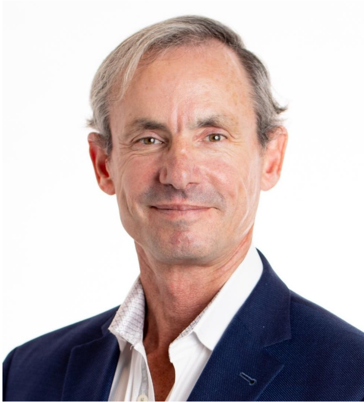
L'ex vice segretario alla Difesa per l'intelligence Christopher Mellon.

Secondo Mellon, una volta che i membri del Congresso avranno acquisito una maggiore consapevolezza delle informazioni fornite al loro staff e all'Ispettore Generale, saranno in grado di determinare rapidamente la verità, se avranno la volontà di farlo.