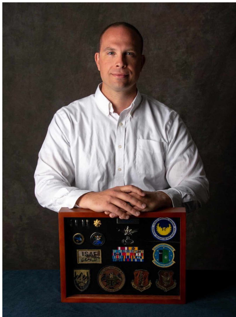
David Charles Grusch (Copyright © D. Grusch. Immagine riprodotta su gentile l'autorizzazione degli autori).

Dal 2019 al 2021 è stato rappresentante dell'Ufficio NRO presso la Task Force per i Fenomeni Aerei Non Identificati [UAPTF]. Dalla fine del 2021 al luglio 2022, è stato il co-responsabile dell'NGA per l'analisi degli UAP e il suo rappresentante nella Task Force.