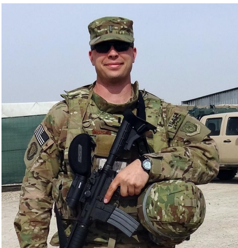
David Grusch in Afghanistan nel 2013 (Copyright © D. Grusch. Immagine riprodotta su gentile l'autorizzazione degli autori).

Secondo un documento di valutazione delle prestazioni dell'NRO del 2021, Grusch è uno stratega di intelligence con molteplici responsabilità che ha "analizzato i rapporti sui fenomeni aerei non identificati" e "ha operato per colmare le lacune informative della leadership del Congresso". È stato valutato dal Vicedirettore del Centro Operativo dell'Ufficio NRO come "abile ufficiale di staff e stratega" e "integratore di forze totali con soluzioni innovative e concreti risultati".